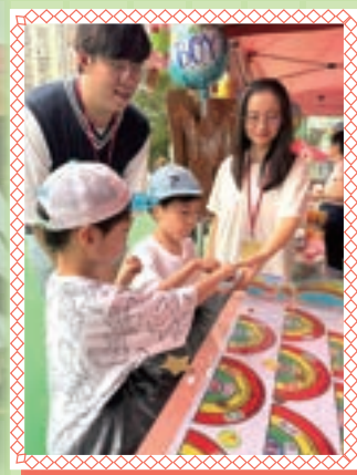
小朋友們大讚攤位遊戲好玩