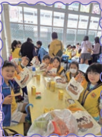
同學們都收到基先送贈的禮物。