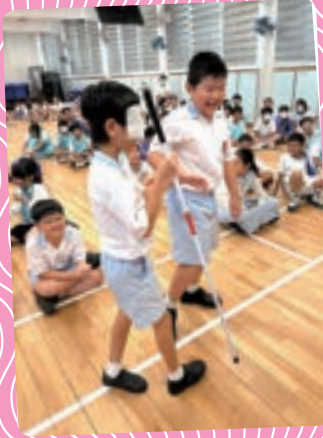
學生親身體驗盲人走路的情況