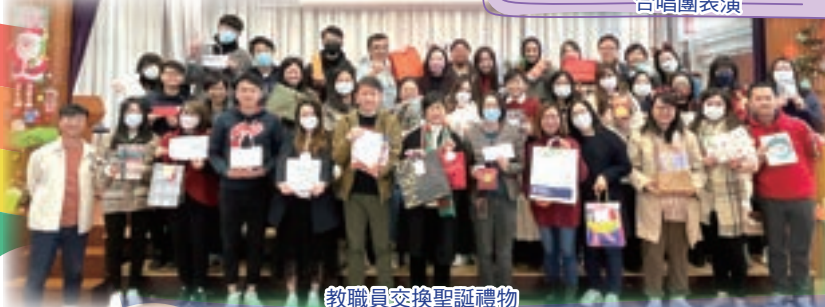
教職員交換聖誕禮物