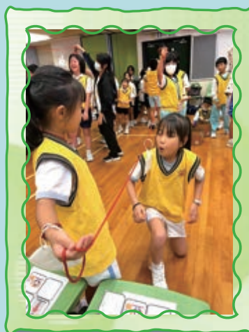
同學投入參與活動。