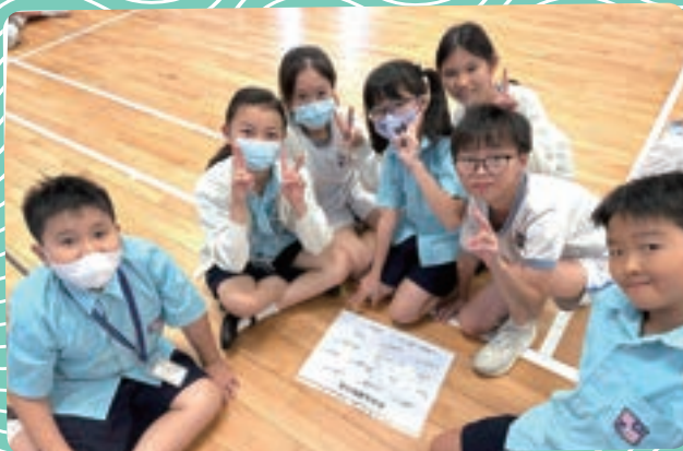
小組活動新奇有趣