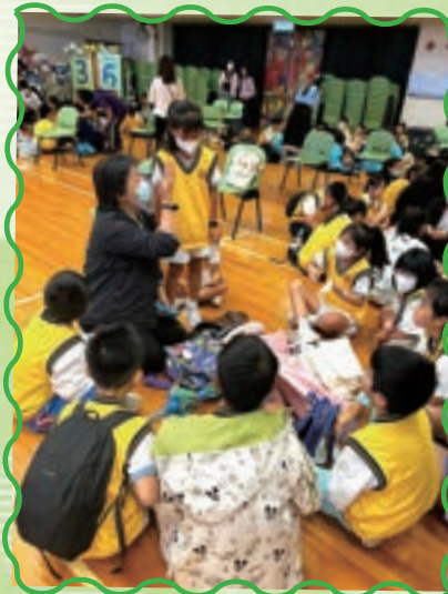
同學探討朝聖的意義。