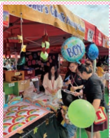
大家都為慈善出一分力