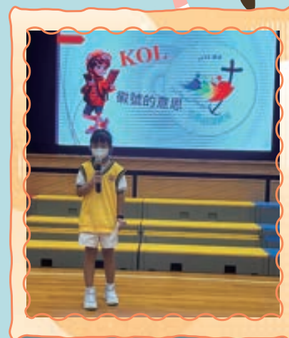
同學向大家匯報「禧年徽號KOL」的意思。