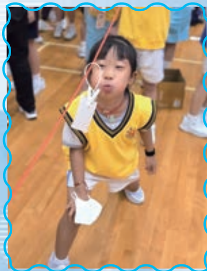
同學投入參與活動。