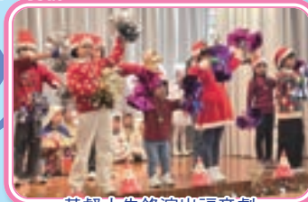
基督小先鋒演出福音劇