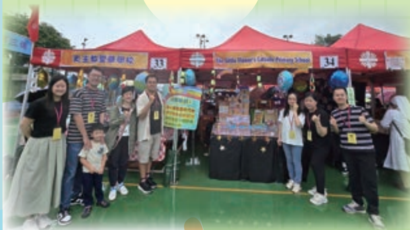
本校校長、校友及教師共同參與明愛賣物會活動

本校設計了「擲出個希望」攤位遊戲，讓玩家將金幣擲向貼有「睿智」、「超群」、「家庭」及「孝親」等這些得獎項目的彩虹池。除了透過攤位遊戲得到慈善收益外，公教老師也向所屬的堂區收集物品，讓本校校友及學生嘗試透過義賣物品去幫助有需要的貧苦大眾，對他們來說，是一個難能可貴的體驗。