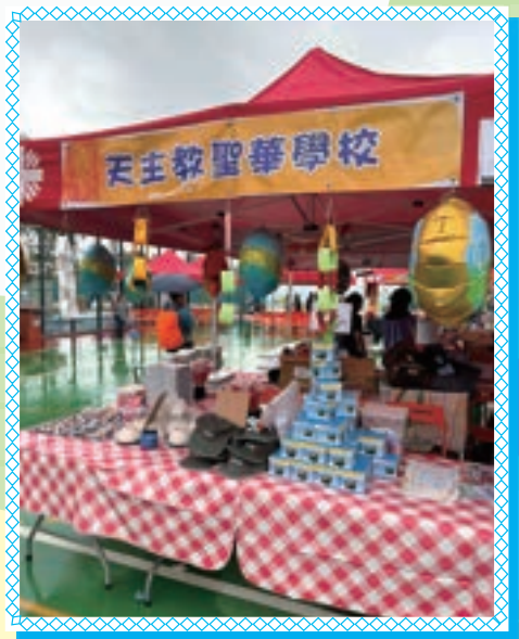
天主教聖華學校慈善攤位