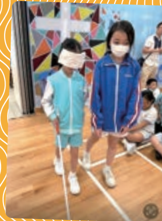
學生靠旁邊同學的指引蒙眼走完指定路線