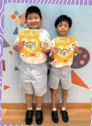
同學們獲得嘉許，拍照留念

「義工體驗計劃」透過具真實感的體驗學習及義工服務，讓學生接觸豐富的社會議題資訊，並透過真實個案或社會實驗影片深入了解相關議題。課堂中有很多具互動性的小組討論及分享，讓學生有足夠的反思機會，促進學生全人發展，並為將來培育人才。同學們積極參與，獲益良多。