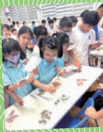
同學拿著提示卡，盡力完成任務