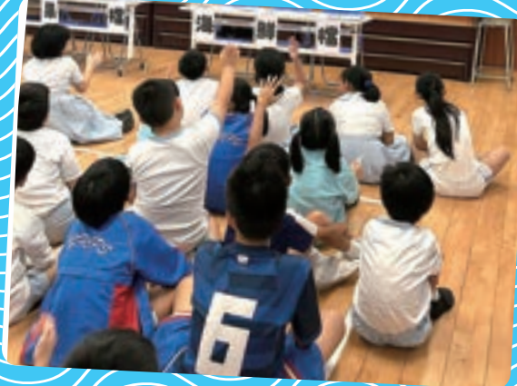
同學積極回答問題，樂在其中